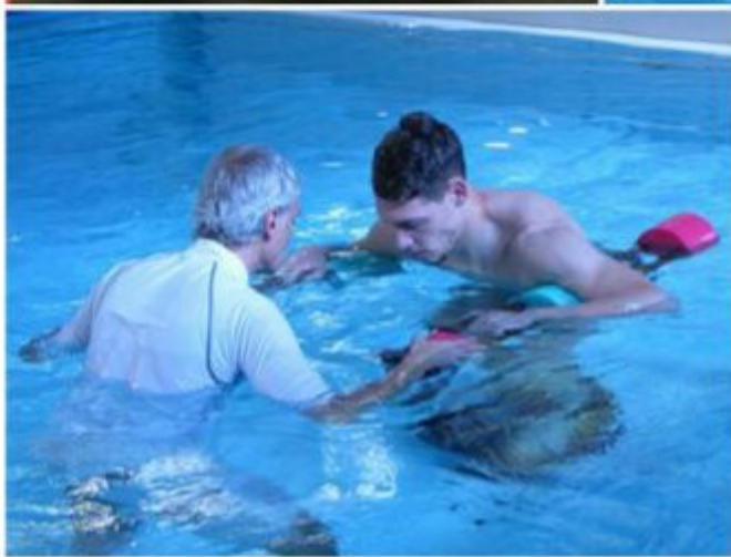
La folla che ha atteso Andrea Belotti di fronte al centro commerciale Le Gru. Il Gallo firma autografi e prosegue la riabilitazione in piscina